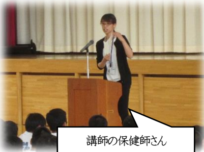
講師の保健師さん