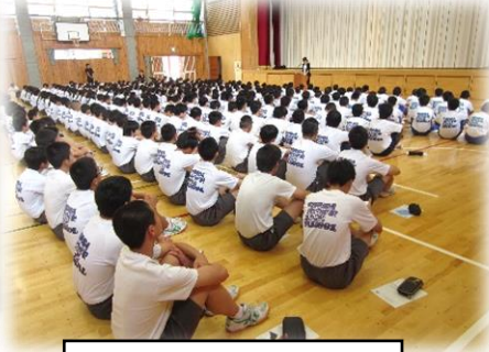
二人組でロールプレイ(2年)