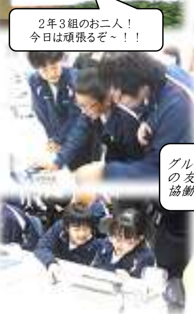
グループ の友との 協働作業