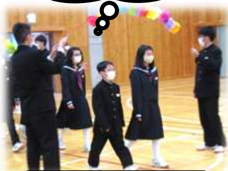
生徒会役員より記念品贈呈