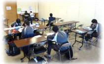
昨年度の様子から