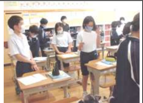
1学年：英語の授業の様子から。店での会話がスムーズにできるように音読練習をしている場面。