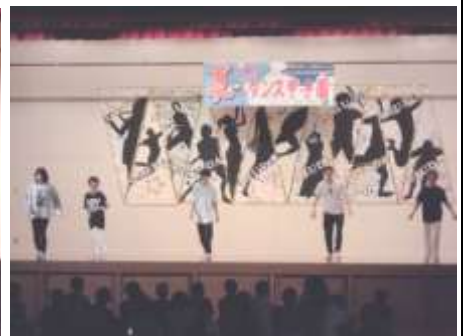
3学年：体育の授業の様子から。グループごとにダンスの発表をしている場面。