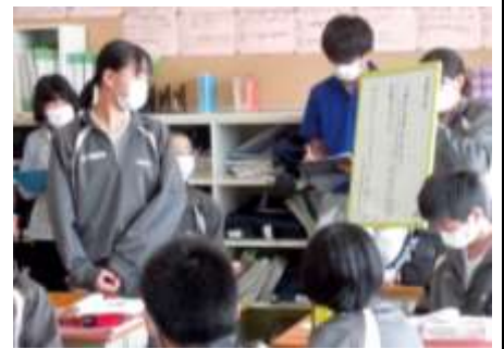
2学年：国語の授業の様子から。話し合ったことをホワイトボードにまとめ、発表している場面。