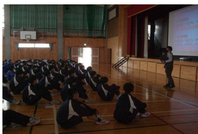
4/7 部活動発足会～全員が係の先生の方を向いて聴く姿