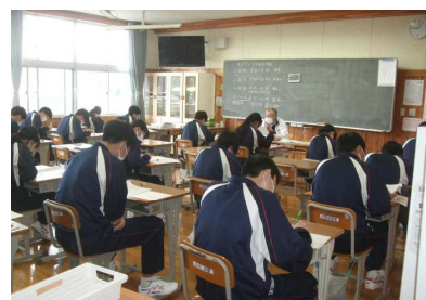
4/18 全国学力学習状況調査(3年)～粘り強く取り組む姿