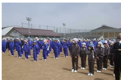
4/14 避難訓練～全校生徒が忘れずに手ぬぐい着用