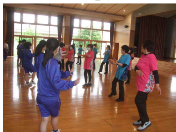
公民館体験～地域の方とリズムダンス