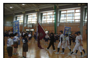
壮行会・堂々と行進