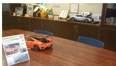
校長室の展示物～生徒がよく見にきます。是非お立ち寄り下さい。