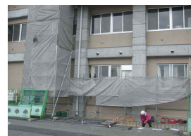
工事本格化・三階まで組まれた足場

今月よりまだエアコンが設置されていなかった各教科の特別教室(音楽室、美術室、家庭科室、調理室)、図書館、職員室、事務室、校長室の各箇所で大規模に設置工事が始まりましました。秋までには完了する予定ですが、それまでの間、工事車両の出入りもあるため、駐車場で使用できない場所があり、保護者の皆様にはご迷惑をおかけします。学びの環境を整えるために、何卒ご理解とご協力をよろしくお願いいたします。