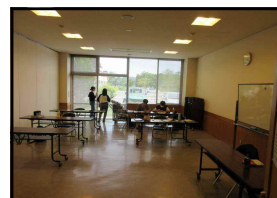
静かな環境で黙々と取り組む姿

7月20日(土) 13:00～17:00 あいとびあ白田で行います。数学を教えてくれるボランティアの方もいます。今年度はこれまで3年生しか参加していないので、1・2年生も是非とも参加してください。冷房もあり、一人になって黙々と集中できる学習環境が整っています。静かな自習室と質問や歓談が可能な自習室あり、途中退室も自由です。