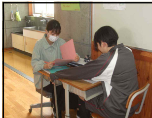
生徒相談日～テスト結果を踏まえて面談