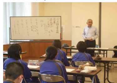
公民館体験～地域講師による俳句講座