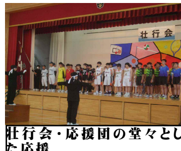
壮行会・応援団の堂々とした応援