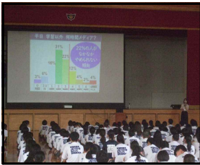
情報教育講演会～SNSの使い方に注意