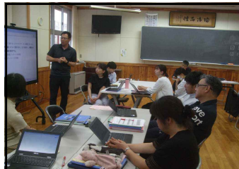
日々の職員研修～生徒下校後の授業改善研修