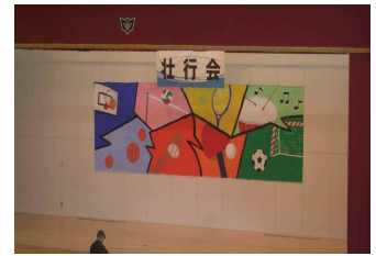
壮行会のために美術部が制作したステージバック