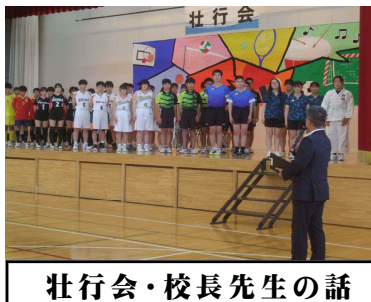
壮行会・校長先生の話