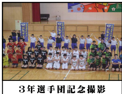
3年選手団記念撮影