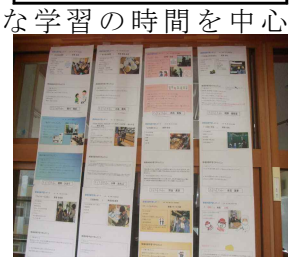
2年職場体験まとめ