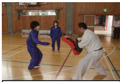
公民館体験～地域の指導者による空手教室

今回は、学校経営方針、部活動方針、生徒の学びの様子を共有した上で、委員の方から本校に寄せる願いや要望をお聞きしました。また、委員の方からは「登下校の見守りをしているが、登下校時に横断報道を渡りきった後、礼儀正しく相手運転手に挨拶できる生徒が多い」「白田の子どもたちのために頑張ってもらいたい」とのお話もあり、今後も地域の方と連携しながら、地域に開かれた学校を目指して実践して参ります。次回は11月で本校の非違行為防止に向けた取り組みについてご意見をいただく予定です。