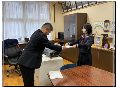
校長先生より新三役任命式

この11月、1年生は、12月2日(月)に予定されている小学 校6年生を招く新入生説明会に向けて準備を進めておき、先輩となる2年生は、25日に行われる生徒会引き継ぎの時期に、3年生は、3年間のまとめの時期になり、15日には高校の募集定員が正式に発表され、いよいよ具体的な進路の方向性が決まるといわれています。各学年でそれぞれに向けて