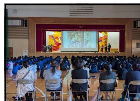
図書委員会・朗読劇

11月7日(金)に本校を会場に、図書館運営に関わる取り組みを発表する長野県図書館大会(北信越地区学校図書館研究大会)が行われ、来校された図書館関係者へ本校の生徒会図書委員会による読書週間での実践を公開しました。当日は、生徒集会で、『幸福の王子』の朗読劇や多読者ランキング等の発表があり、北信越地区の各地から来校された方々より本校の図書委員会の充実した実践に対してお褒めの感想を寄せていただきました。準備してくれた図書委員会の皆さん、参観された地域の方々、本当にありがとうございました。