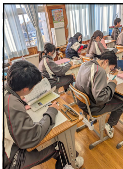
人権教育月間・自分を振り返る機会に

いよいよ師走を迎え、2学期の登校日数もあと17日となりました。11月は身の回りの差別や偏見、様々な人権問題について考える人権同和教育重点月間でした。10月30日(木)の参観日に行われたPTA人権同和教育講演会(講師:長野県地方自治局佐久支局長 中島さん)では、「インターネットと人権」に関わる話をお聞きし、スマートフォンやタブレット端末の使い方を考える貴重な機会となりました。この講演会を皮切りに、各学年で実態アンケートで今の人間関係を振り返ったり、同和教育問題をはじめとする様々な人権問題を学んだり、磨き、他者とのより良い関わり方について考える有意義な時間となりました。