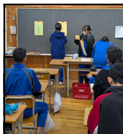
密を避け、教室で行われた生徒会選挙

また、この11月はインフルエンザが流行した影響で、小学校6年生を招いての新入生説明会や生徒会立会演説会・選挙が延期となりましたが、今週に入り、インフルエンザ流行も峠を越えて、通常の学校生活が戻りつつあります。1日(月)にようやく行われた生徒会立会演説会・選挙では、新しい生徒会長・副会長が選出され、正式に2年生へ引き継がれることとなります。1年生も1月の新入生保護者説明会に向けて、先輩となる準備を進めています。3年生は、中学校3年間のまとめの時期になり、11月18日には高校の募集定員が正式に発表され、いよいよ具体的な進路の方向性が決まる時期となってきました。『終わり良ければ全て良し』～各学年で気持ちよく今年を締めくめるべく、学校教育目標「信頼される人になる」の具現に向けて、生徒職員一丸となって取り組んで参ります。保護者懇談会ではご多用の中にもかかわらずご来校いただき、誠にありがとうございます。学級担任以外にも相談窓口を設けています(校長、教頭、養護教諭等)。懇談で来校された折でも、別日でも、電話でも構いませんので、何かありましたら気楽にご相談ください。