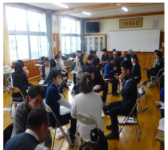
白田小学校の先生方との合同研修「うすだっ子育成フォーラム」