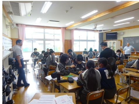
小中連絡会 英語の参観