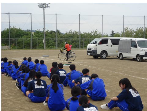
1・2年交通安全教室